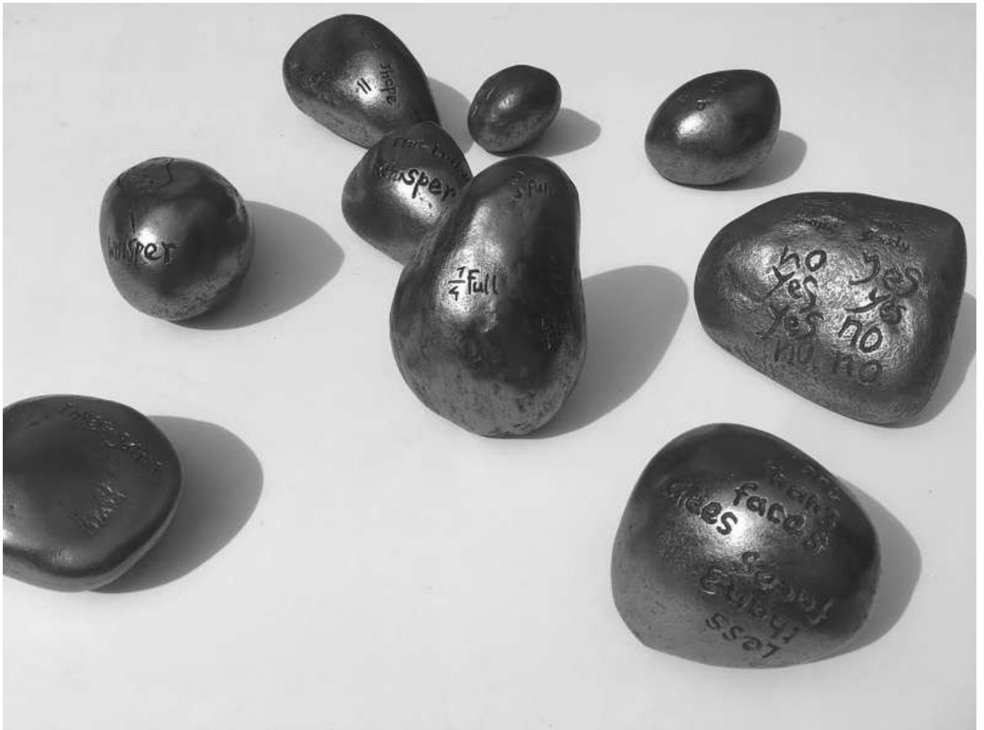
Area (Program) Diogo Pimentão Cemento y grafito Medidas variables 2019