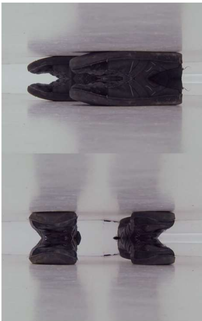
Touch (out) Diogo Pimentão H-264 stereo 5m 56s Video 2019