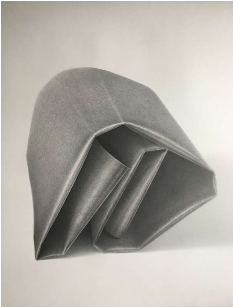
Construct (Entity) Diogo Pimentão Impressió, paper i grafit 69.5 x 54.7 cm 2019