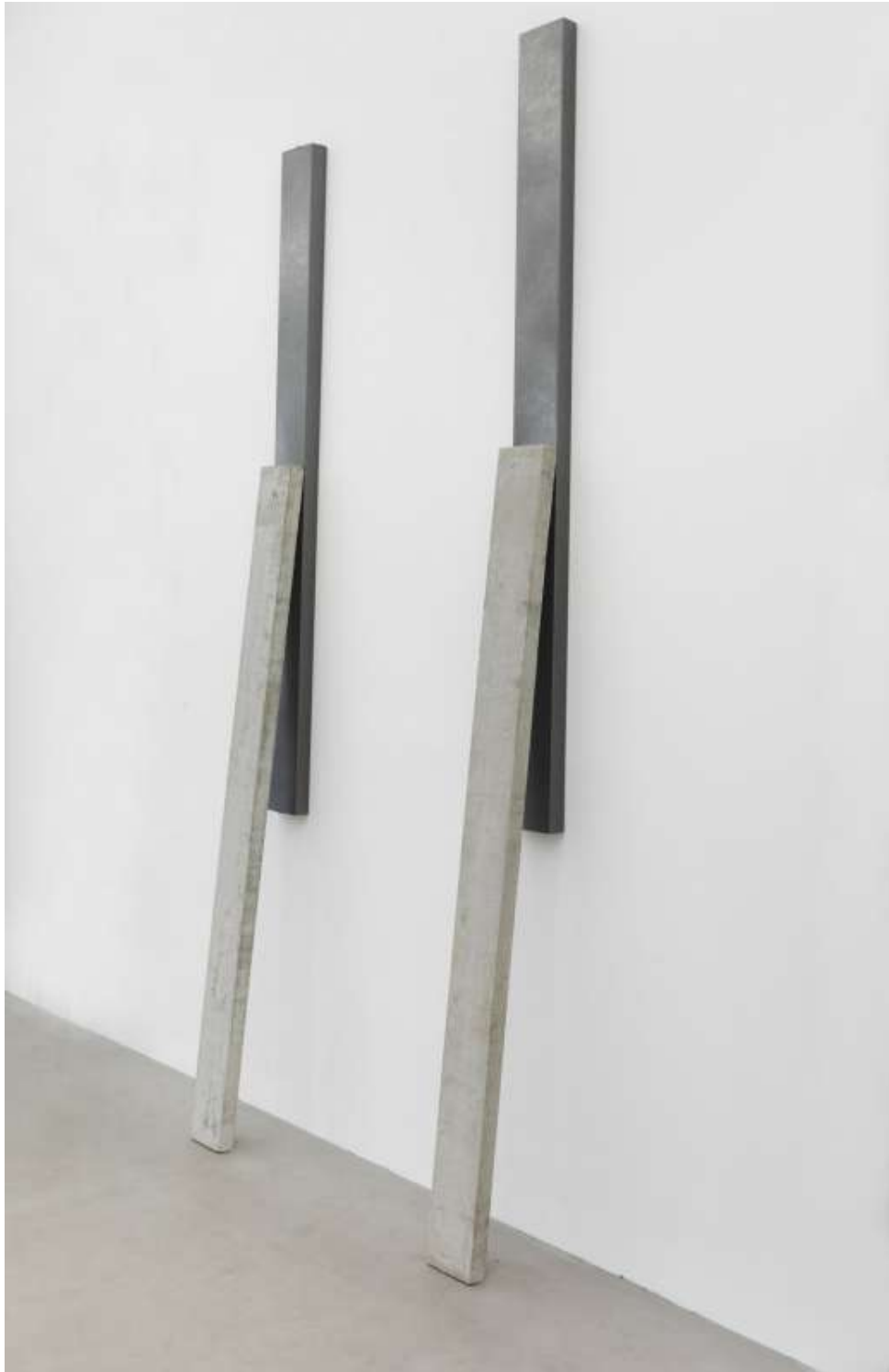
Depth (passage) y Depth (encounter)