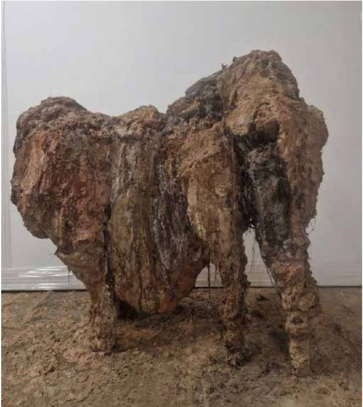
Lionel Sabatté Bébé mammoth , 2023 Cemento, chatarra, fibras vegetales 100 x 100 x 35 cm